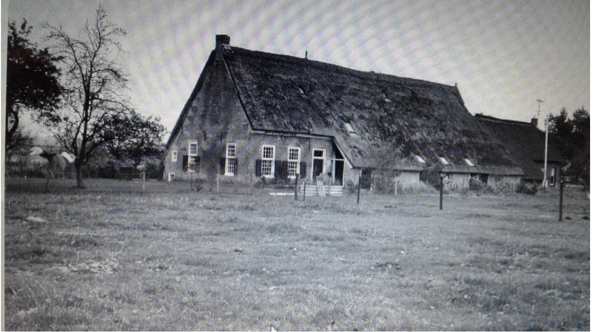
O252, Roelof Gerardus Jantiena hoeve, Thies-Haandrikman