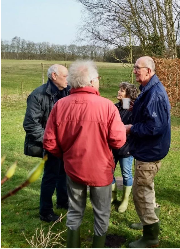
Figuur 6: koffiepauze tijdens schoonmaken van paddenschermen (2020)