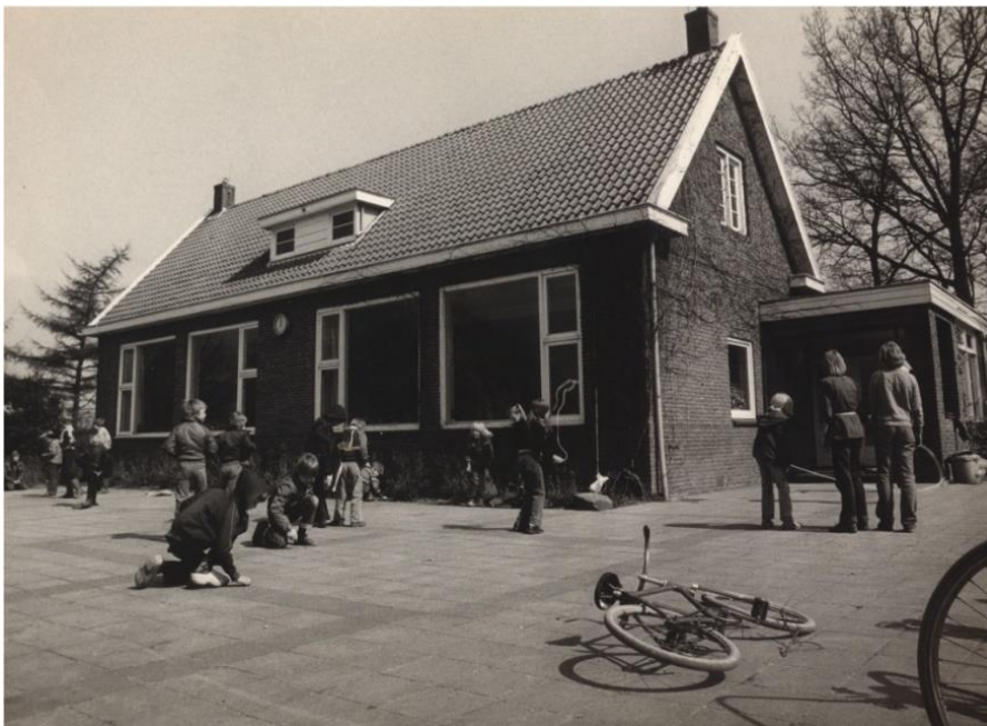
Figuur 1: school met schoolplein

Met 28 leerlingen in 1975 was de school in Gasteren een éénmannschool. “Maar omdat veel ouders in Gasteren weinig opleiding hadden genoten, konden wij er – als gevolg van een regeling van de regering - een leerkracht bij krijgen.” Naast de school stond de meesterswoning. Van het uitzicht van deze woning op de paasbult schrokken ze wel even. “Dat was gewoon een vuilnisbelt.”