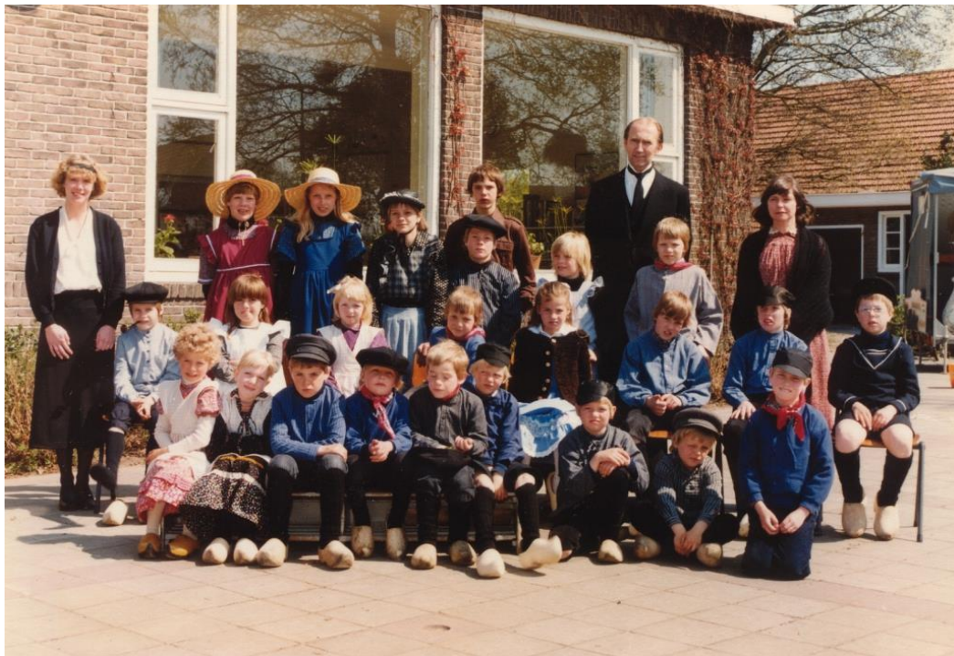
Figuur 2: school bestaat 50 jaar